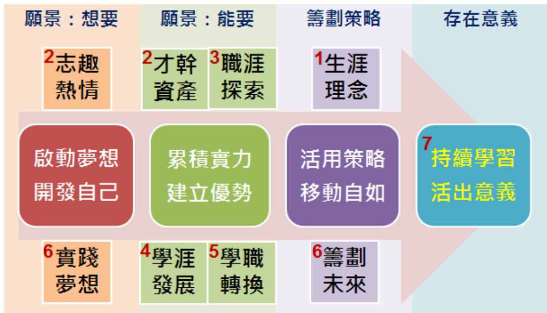
圖 4-1 教育部青年發展署教材之主題架構

資料來源：劉淑慧、陳斐娟、吳淑禎、許鶯珠、洪雅鳳、楊育儀（送審中）。知識經濟時代的大專生涯發展課程設計：陰陽調和、頂天立地之道。