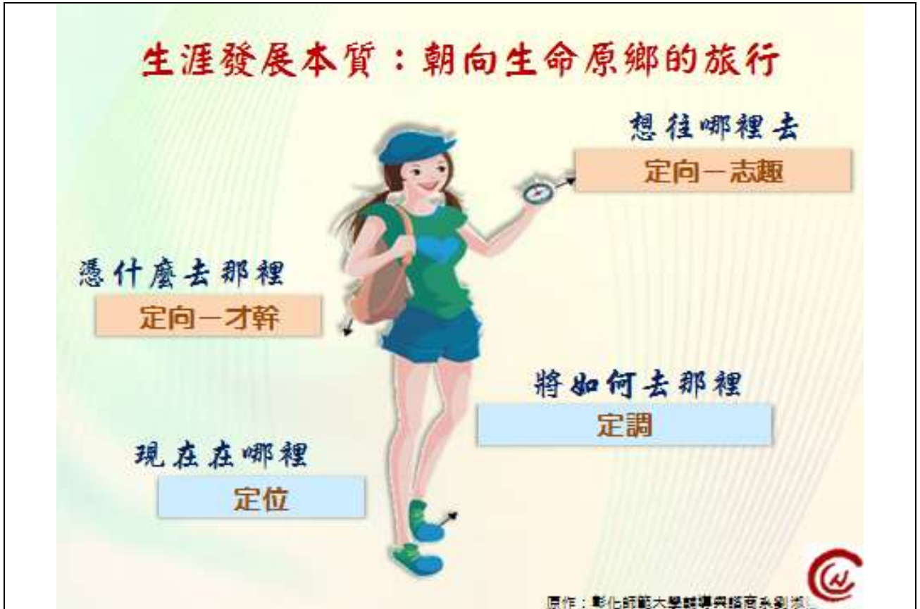
圖：每個人都是自己生涯歸鄉之旅的生涯專案籌劃與管理師