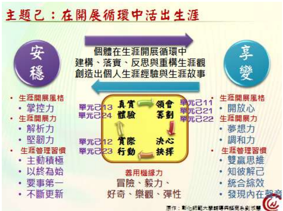
圖：靈巧智慧的籌劃策略綜合運用精挑掌控與悅納變通使之相輔相成