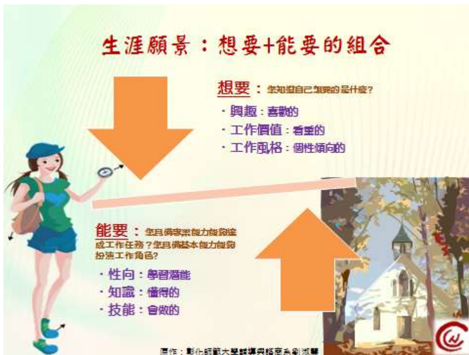
圖：生涯願景在想要與能要之交織中成形